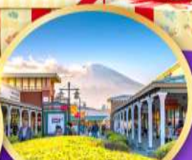
โกเทมมะ-พรีเมี่ยมเฮ้าส์