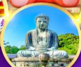
วัดโคโคคุอิน