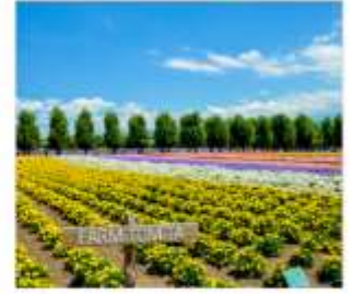
ทุ่งลาเวนเดอร์โทมิตะ