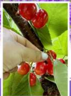
กิจกรรมเก็บเชอร์รี่

ออนเซ็น 2 คืน นน.กระเป๋า 23 กก. 1 ใบ 6Days 4Night