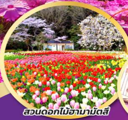
สวนดอกไม้ฮามามัตสึ