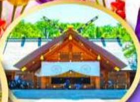
ศาลเจ้าออกโทโด