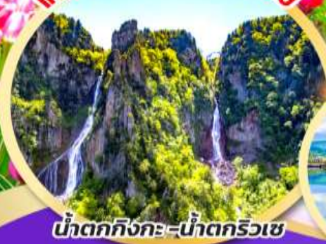
น้ำตกกิ่งกะ-น้ำตกริวเซ