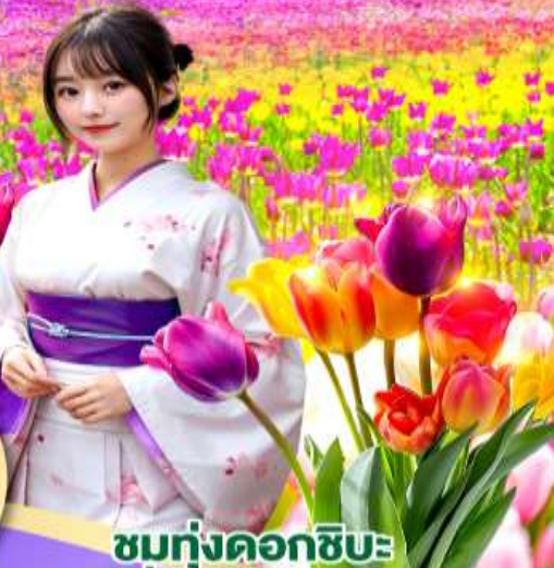
ชมทุ่งดอกชิบะ