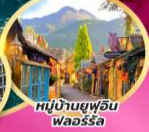
หมู่บ้านยูฟุอิน ฟลอริดา