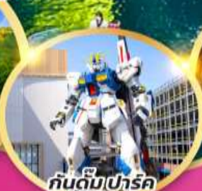
กันดั้มปาร์ค ฟุกุโอกะ