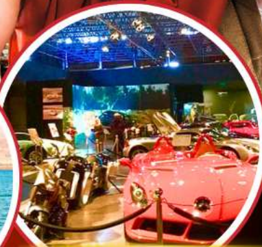
Royal Automobile Museum