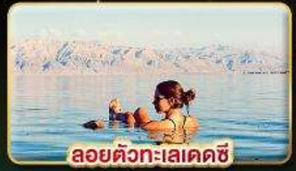
ลอยตัวทะเลเดคซี