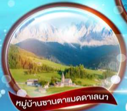
หมู่บ้านซานตาแมดดาเลนา