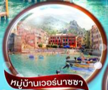
หมู่บ้านเวอร์นาชซา