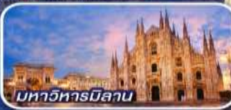
มหาวิหารมิลาน