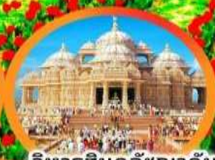
วิหารอินดูอักษมาตัม