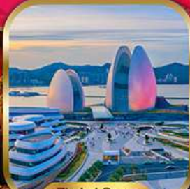
Zhuhai Opera House