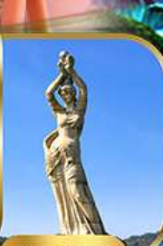
จูไห่ฟิชเชอร์ทิสรา