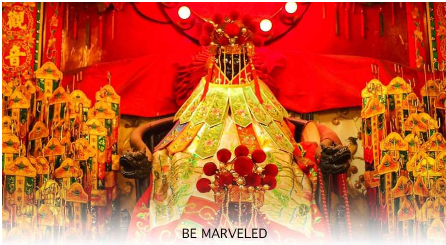
วัดเจ้าแม่กวนอิมฮองฮำ (ยิมเงิน)

ฉะนั้นการมาบูชาขอพรท่าน จะช่วยเสริมดวงไม่ให้เพลิงพล้ำแก่ศัตรู ทำให้มีมิตรที่ซื่อสัตย์ และคุ้มครองบริวารให้ก้าวหน้า และอยู่เย็นเป็นสุข ซึ่งผู้ประกอบอาชีพ ตำรวจ ทหาร และ นักการเมือง จึงมักจะนิยมบูชาเทพเจ้ากวนอู เป็นพิเศษ