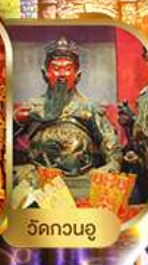
วัดกวนอู