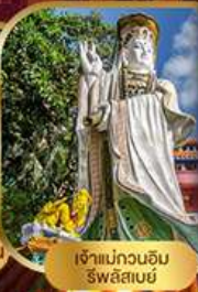
เจ้าแม่กวนอิม ริฟลิสซีย์