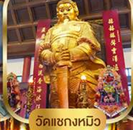
วัดแฉกงหมิว