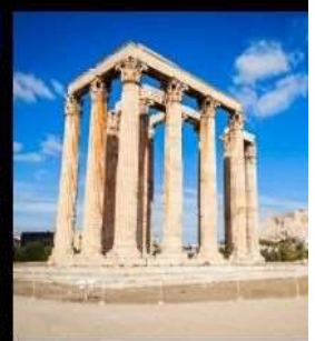
Temple Of Olympian