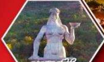
อนสาวรีย์ มารดาแห่งจอร์เจีย