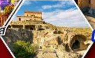
เมืองถ้ำอพิลิสต์ซิคเค์

แพคเกจ Rooms Hotel โรงแรมวิวทิวทัศน์ของเทือกเขาคอเคซัส