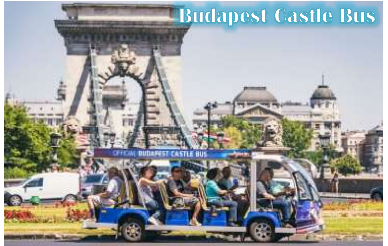
Budapest Castle Bus

บูดา Castle Hill *เนื่องจากตัวปราสาทตั้งอยู่บนเนินเขา การเดินทางโดยรถไฟไฟฟ้า จะเพิ่มความสะดวกสบายให้กับท่าน โดยรถไฟไฟฟ้าจะจอดรับและส่งตามจุดต่างๆ ในย่านเมืองเก่า ไม่ต้องเดินเท้าเป็นระยะทางไกล* จากนั้นนำท่านเดินชมความงดงามของเมืองเก่ารอบๆปราสาทบูดา ที่เริ่มมีการก่อสร้างมาตั้งแต่ปี ค.ศ.1265 และต่อเติมปรับปรุงมาโดยตลอด จนกระทั่งปัจจุบัน โดยตัวอาคารในปัจจุบันเราจะเห็นเป็นสไตล์บาโรค ที่ดู