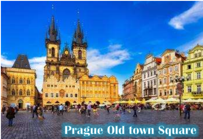
Prague Old town Square