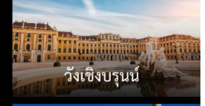
วังเซิงบรุนน์