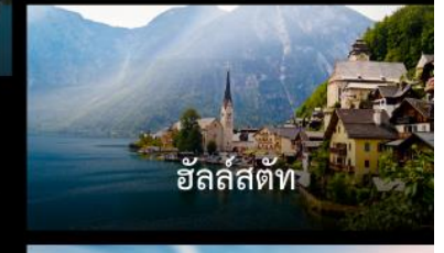
ฮัลล์สตัดท์