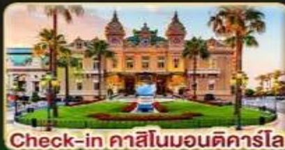
Check-in คาสีโนมอนติคาร์โล