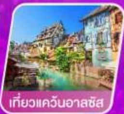
เที่ยวแควินออลซัส