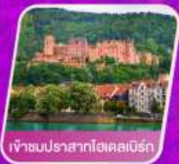
เจ้าชมนปราสาทไฮคอสเบิร์ก

โรงแรม 4 ดาว อาหาร 14 มื้อ โทคน้ำ 14 เที่ยว น้ำหนัก 23 กก.