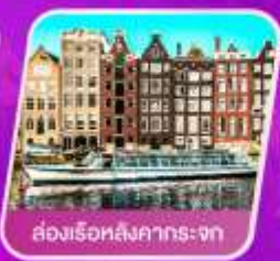
ล่องเรือหลังคากระซก