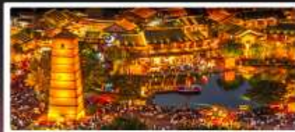
เมืองโบราณลั่วหยี่