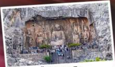
ถ้ำพาทหลงเหมิน