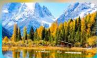
กูเวาสี้ครุณี