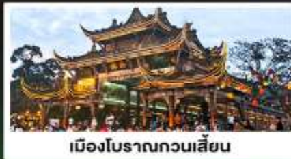
เมืองโบราณกวนเสียน