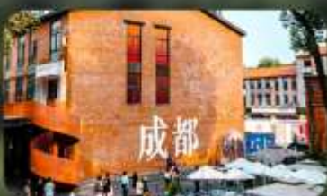
ดงเจียวจี้

HOLIDAY INN EXPRESS HOTEL หรือเทียบเท่า 4 คาว