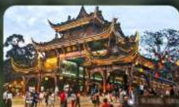
เมืองโบราณกวนเสี้ยน