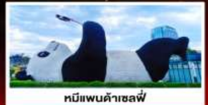
หมีแพนด้าเซลฟี่