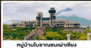
หมู่บ้านโบราณชนเผ่าเซียง