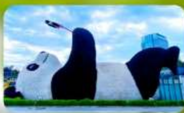
หมีแพนด้าเซลฟี่