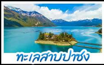
ทะเลสาบปาซง