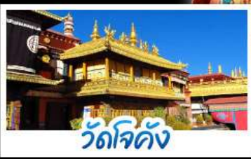
วัดโจคัง