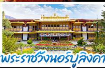
พระราชวังเนอร์บูลิงคา