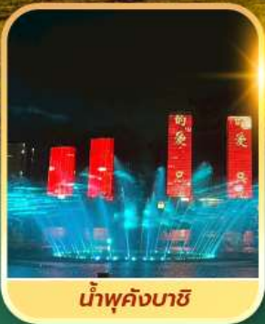
น้ำพุคังบาซี