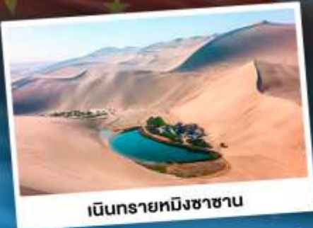
เนินทรายหมีซาซาน