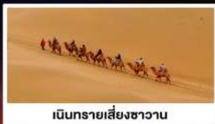
เนินทรายเสี่ยงชาวน