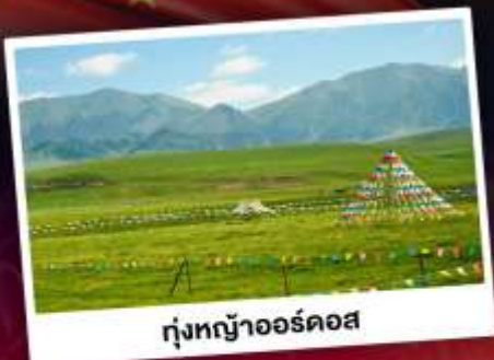
ทุ่งหญ้าออร์ดอส