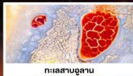
ทะเลสาบอูลาน