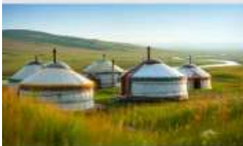
ทุ่งหน้าออร์ดอส