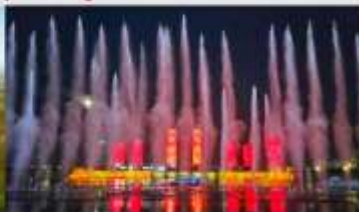
น้ำพุคังปาซือ