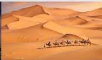
ทะเลทรายเสียงชวาน