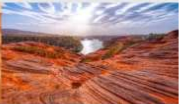
อุทยานหุบเขาคีลิน

*ทางบริษัทฯ ขอสงวนสิทธิ์ในการสลับโปรแกรมทัวร์ตามความเหมาะสมขึ้นอยู่กับสถานการณ์ทำงาน โดยค่าใช้จ่ายผลประโยชน์ของลูกค้าเป็นสำคัญ