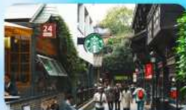
ถนนชอยกวางซวยแคบ