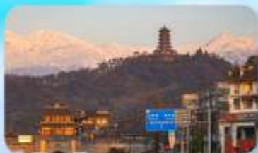
เมืองโบราณกวนเสี้ยน