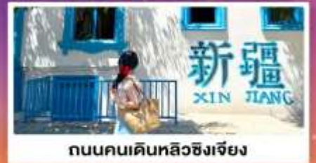
ถนนคนเดินหลิวซิงเจียง