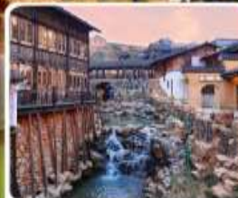
เมืองโบราณเหย้าหู