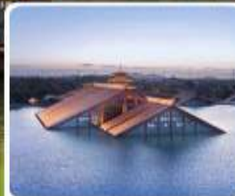
พิพิธภัณฑ์ไดน้ำ กวางฟู่หลิน