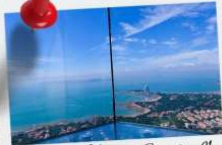
Qingdao Haitian Center ชั้น 81