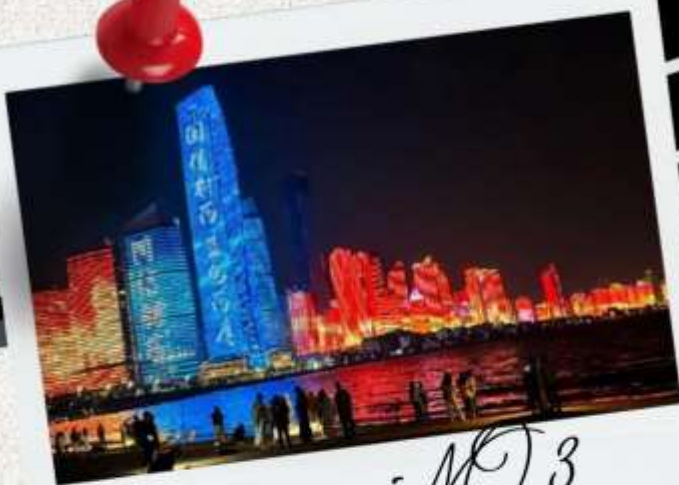
หาดไซเบอร์ MO.3