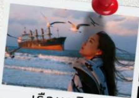
เรือบลูวิส