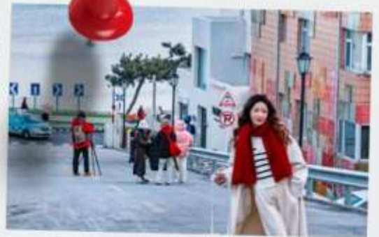
ถนนฮัวจวีปา