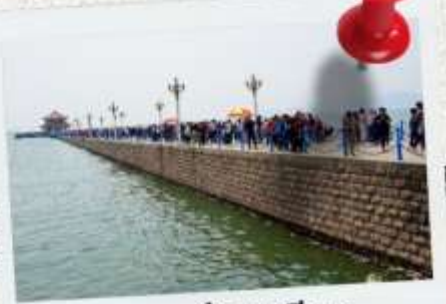
สะพานจ้านเจียว