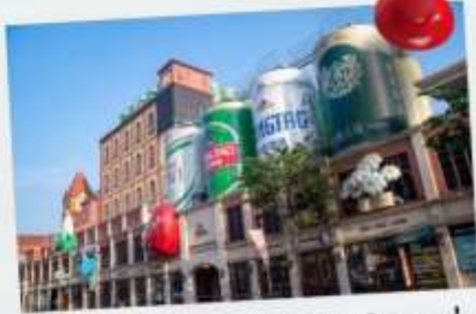
พิพิธภัณฑ์เบียร์ชิงเต่า