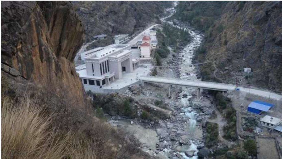
ถึง ด่านพรมแดน พาท่านเดินทางตรวจคนเข้าเมืองโดยการเข้าเนปาลสำหรับคนไทยต้องใช้วีซ่า