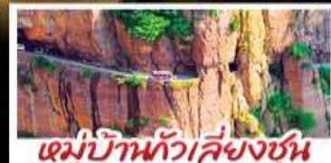
หมู่บ้านทิวเสี่ยงซุน