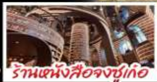
ร้านหนังสือจุงชู่ก้อ