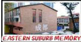
EASTERN SUBURB MEMORY