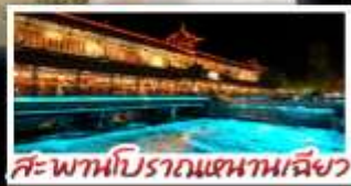
สะพานโบราณหนานเฉียว