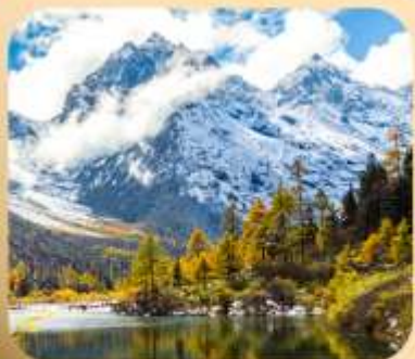
“ปี่ผิงโกว”

ชมธรรมชาติ 2 อุทยานขึ้นชื่อ อุทยานภูเขาสี่ดรุณี + อุทยานปี่ผิงโกว สะพานหนานเฉียว • ถนนคนเดินไถ่กู่หลี่ + ซุนซีลู่ + Pop Mart • ดงเจียวจื่อ