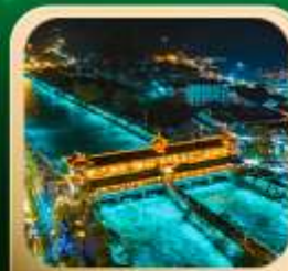
“สะพานหนานเฉียว น้ำตาสีฟ้า”