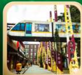
“ดงเจียวจื่อ”