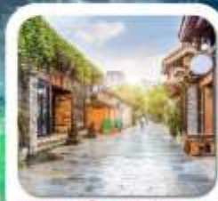
"ชอยกว้างชอยแคม"