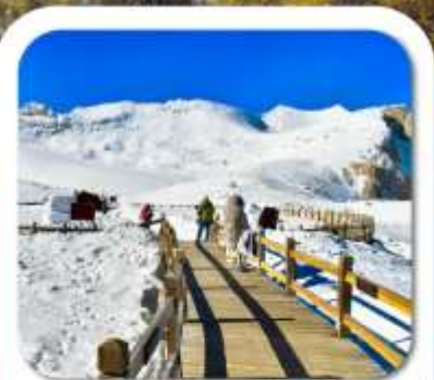
"ต้ากุกลาเซียร์"

เที่ยวชมความงาม 3 อุทยานชื่อดัง : สี่ดรุณี • ป่าเผิงโกว ต้ากุกลาเซียร์ ชมความน่ารักของหมีแพนด้า • จัตุรัสหยางเทียนวู่ ชอยกว้างชอยแคม • ถนนคนเดินซุนซีลู่ • POP MART