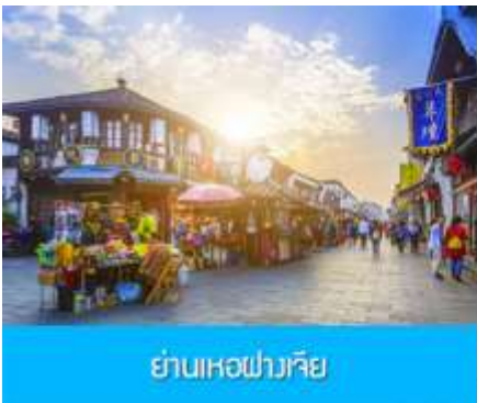
ย่านเหอฝางเจีย

อิสระอาหารมื้อกลางวัน ท่านสามารถเลือกชิม STREET FOOD ขึ้นชื่อมากมายในย่านเหอฝางเจีย