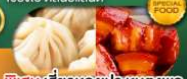
พิเศษ เสี่ยวหลงเป่า หมูแดงพอ เดินทาง ม.ค. - มิ.ย. 69