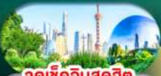
จุดเช็คอินสุดฮิต North Bund Shanghai

เซี่ยงไฮ้ หางโจว ล่องทะเลสาบซีหู ฟรีเดย์