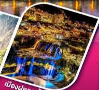
เมืองฝูหลงจิ้น