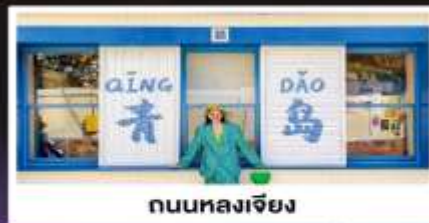
ถนนหลงเจียง