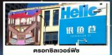
ดรอกซิลเวอร์ฟิช