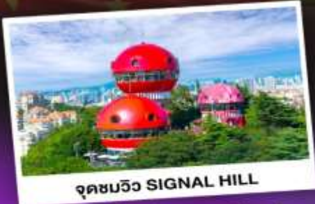
จุดชมวิว SIGNAL HILL