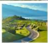
กุซ่าววันชิงชาน