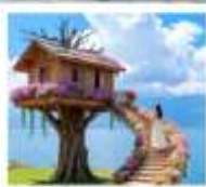
หมู่บ้านหวนยี่

เมืองโบราณต้าหลี่ / มังเรื่อสู่เกาะเสี้ยวฉู / ซานโตรินี่ (รวมรถแบดเจอร์) / ถนนซางเอ้อร์ต้าต้า / กุซ่าววันชิงชาน / ต้าซ่าท่าเรือหลงกั้น โถ้ง $ ทะเลสาบเอ้อไห้ / หมู่บ้านโบราณสี่จิว / หมู่บ้านหวนยี่ / สวนดอกไม้ตามฤดูกาล