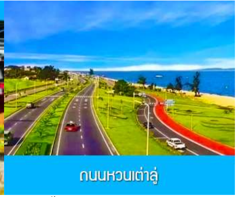
ถนนหวนเต่าลู่