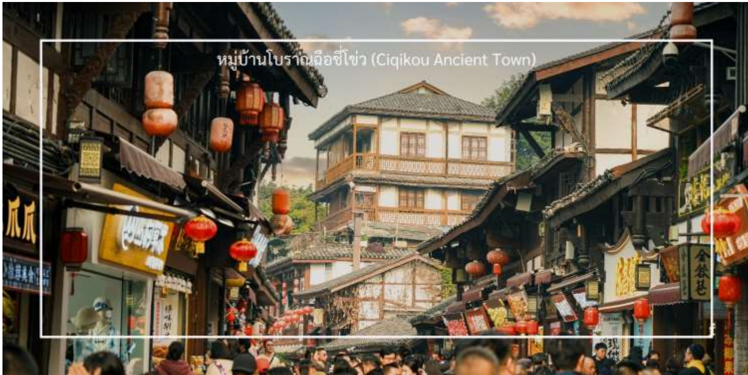
หมู่บ้านโบราณฉีโข่ว (Ciqikou Ancient Town)

จากนั้นเดินทางไปยัง ตลาดหงหยาดัง (Hongyadong) หรือที่เรียกว่า "Hongya Cave" เป็นสถานที่ท่องเที่ยวที่มีชื่อเสียงในเมืองฉงชิ่ง โดยตั้งอยู่ริมแม่น้ำแยงซี มีบรรยากาศที่เต็มไปด้วยวัฒนธรรมและประวัติศาสตร์ ตลาดหงหยาดังเป็นพื้นที่ที่มีอาคารแบบดั้งเดิมที่สร้างขึ้นในสไตล์สถาปัตยกรรมแบบชิโน-ทิเบต โดยมีร้านค้า ร้านอาหาร และบาร์จำนวนมาก ที่นี้คุณสามารถลิ้มลองอาหารท้องถิ่นที่อร่อย เช่น ฮอทพอตฉงชิ่ง (Chongqing Hot Pot) และขนมพื้นเมืองอื่นๆ นอกจากนี้ ตลาดหงหยาดังยังมีวิวทิวทัศน์ที่สวยงาม โดยเฉพาะในช่วงเย็นเมื่อไฟประดับส่องสว่าง ที่ทำให้บรรยากาศมีความโรแมนติกและน่าตื่นตาตื่นใจ คุณสามารถเดินเล่นตามทางเดินที่มีการจัดแสดงงานศิลปะและสินค้าท้องถิ่น