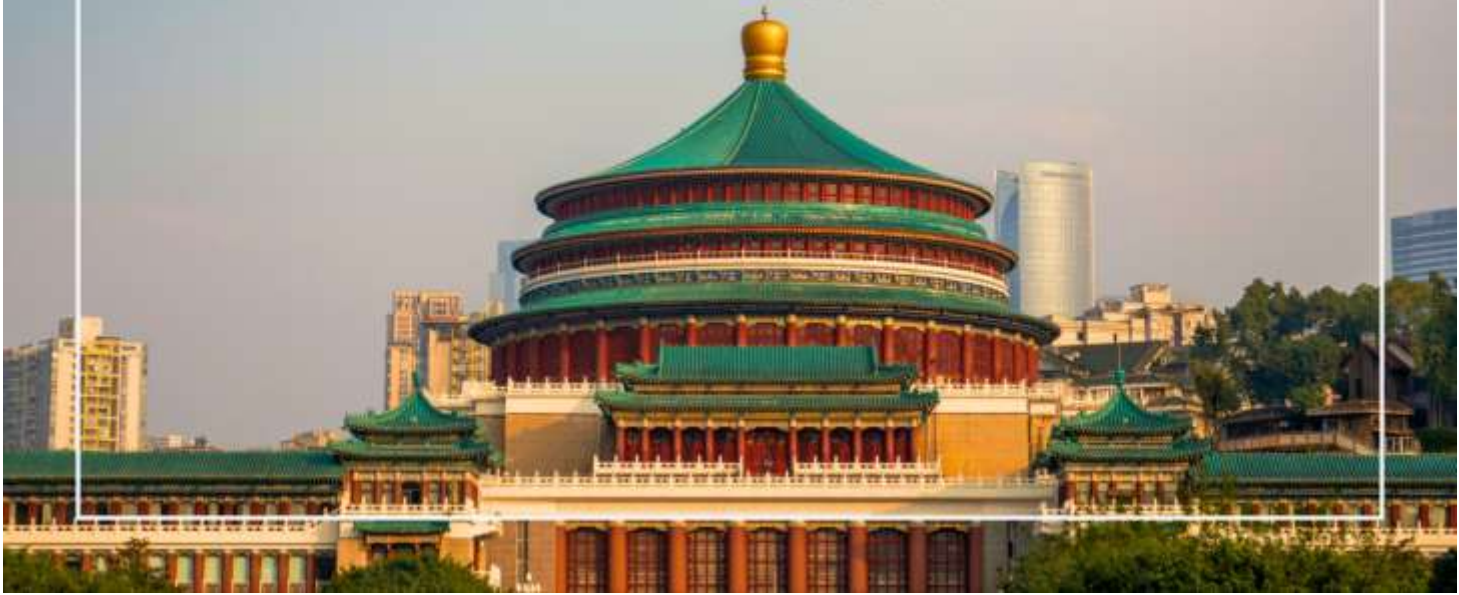
มหาศาลาประชาชนแห่งเมืองฉงชิ่ง (Chongqing People's Grand Hall)

เที่ยง บริการอาหารเที่ยง ณ ภัตตาคาร (มื้อที่ 7) เมนูพิเศษ : สุกี้หม่าล่า