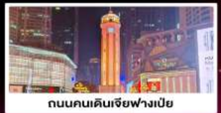
ถนนคนเดินเจียฟางเป็ย