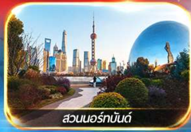
สวนออร์ทันด์