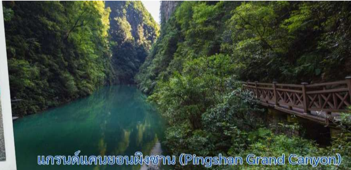
แกรนด์แคนยอนผิงซาน (Pingshan Grand Canyon)