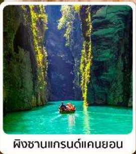
ผิงซานแกรนด์แคนยอน