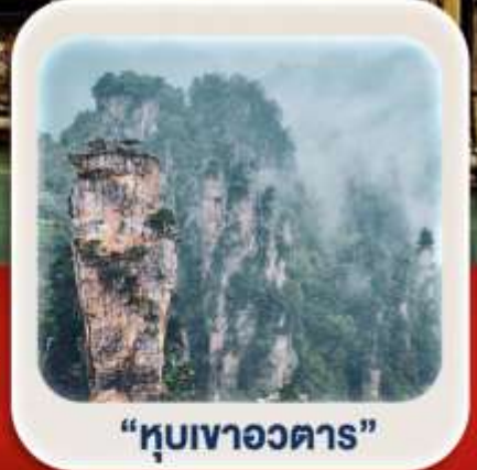
"หุบเขาอวตาร"

นั่งกระเช้าชมภูเขาเทียนเหมินซาน • กำแพงคู่สวรรค์ • ตึกมหัศจรรย์ 72 ชั้น เมืองโบราณเฟิ่งหวง (สองเรือ) + เมืองโบราณฟูหรงเจิ้น **พักติดเมืองโบราณ 2 คืน** ภูเขาเทียนจื่อซาน • หุบเขาอวตาร • สะพานแก้ว+VR4D • ชมโชว์จิ้งจอกขาว