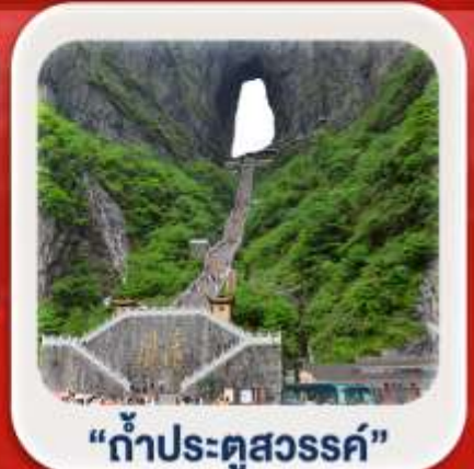
"กำแพงคู่สวรรค์"