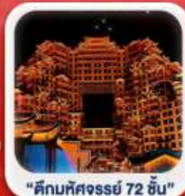
"ตึกมหัศจรรย์ 72 ชั้น"