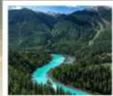
อุทยานคานาสือ

ส่วนนำป่าโบราณ / ทางด่วนทะเลทราย S21 เขตภูมิศาสตร์บาร์ดิง / เขตมิกางทะเล (รวมล่องเรือ) / เซาโปซา ทุ่งหญ้าอาเหอกิ่งกั๊ก / หมู่บ้านเหม่อู่ซุ่น (รวมรถอุทยาน) / จุดชมวิวดาเต็ง ล่องเรือทะเลสาบคานาสือ / จุดชมวิวกานาสือทาลูซุมปลา / ทะเลสาบวงพระจันทร์ ทะเลสาบมิงกรหลับ / ทะเลสาบเทวดา / อารน้ำ 5 สี / เมืองมิกาง (รวมรถไฟเล็ก) แกรนด์แคนยอนดูซานจื่อ / ตลาดต้าปาจาง