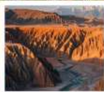
แกรนด์แคนยอนดูซานจื่อ