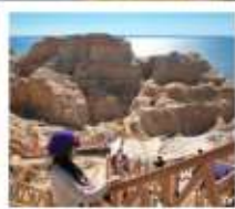
เขตมิกางทะเล