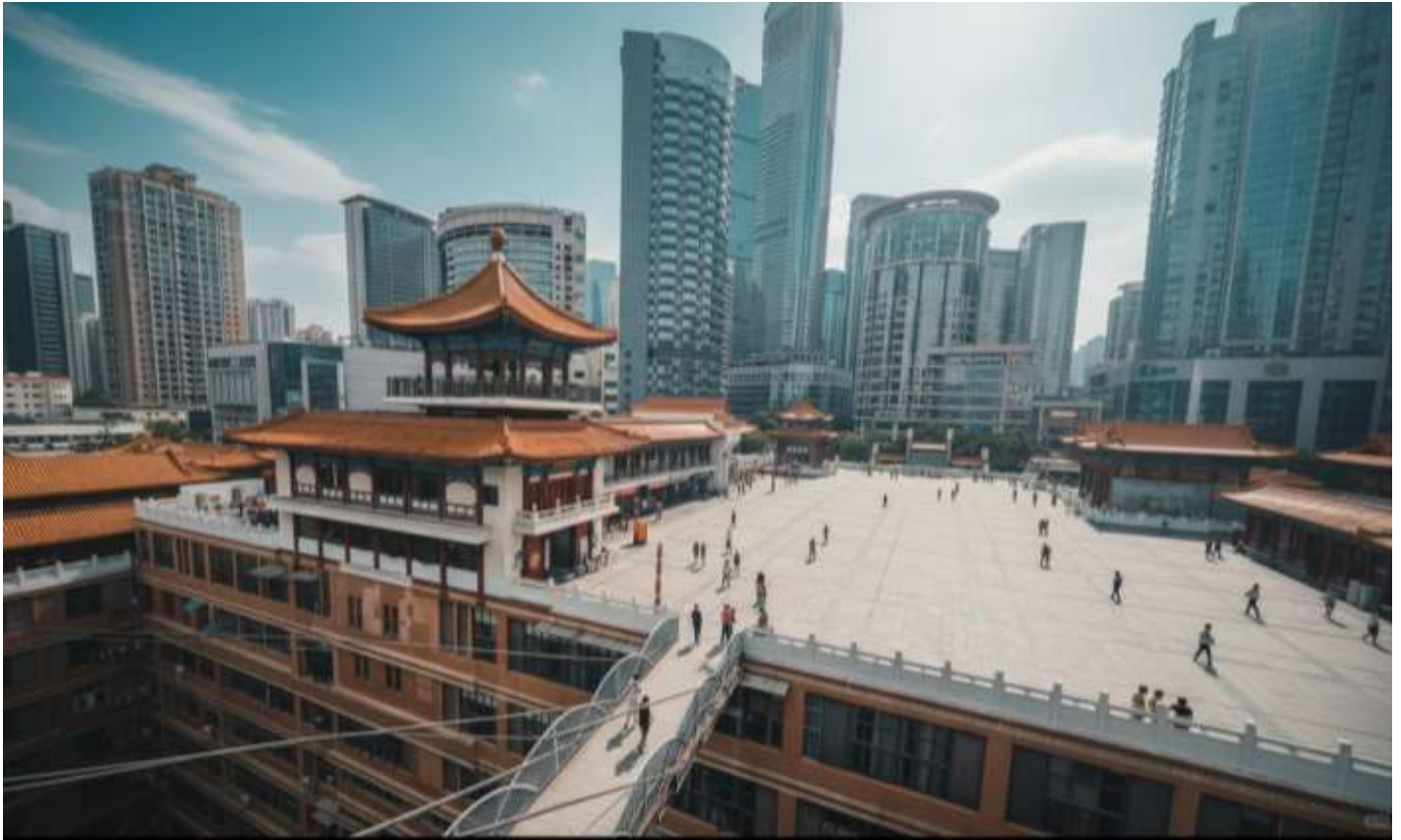
กลางวัน รับประทานอาหารกลางวัน ณ ภัตตาคาร (เมื่อที่ 2)

เมื่อก้าวเท้าเข้าไปใน "หอชุยซิง" คุณอาจพบว่าตัวเองกำลังยืนอยู่บนสะพานที่เชื่อมต่อระหว่างสองยอดตึกสูงเสียดฟ้า! ที่นี่คือจุดที่คำว่า "ชั้น 1" กลายเป็นเพียงแนวคิดที่จับต้องไม่ได้ เพราะทางเข้าของคุณอาจอยู่ที่ชั้น 10 ของตึกหนึ่ง แต่กลับเชื่อมไปสู่ชั้น 1 ของอีกตึกหนึ่งได้อย่างน่าอัศจรรย์