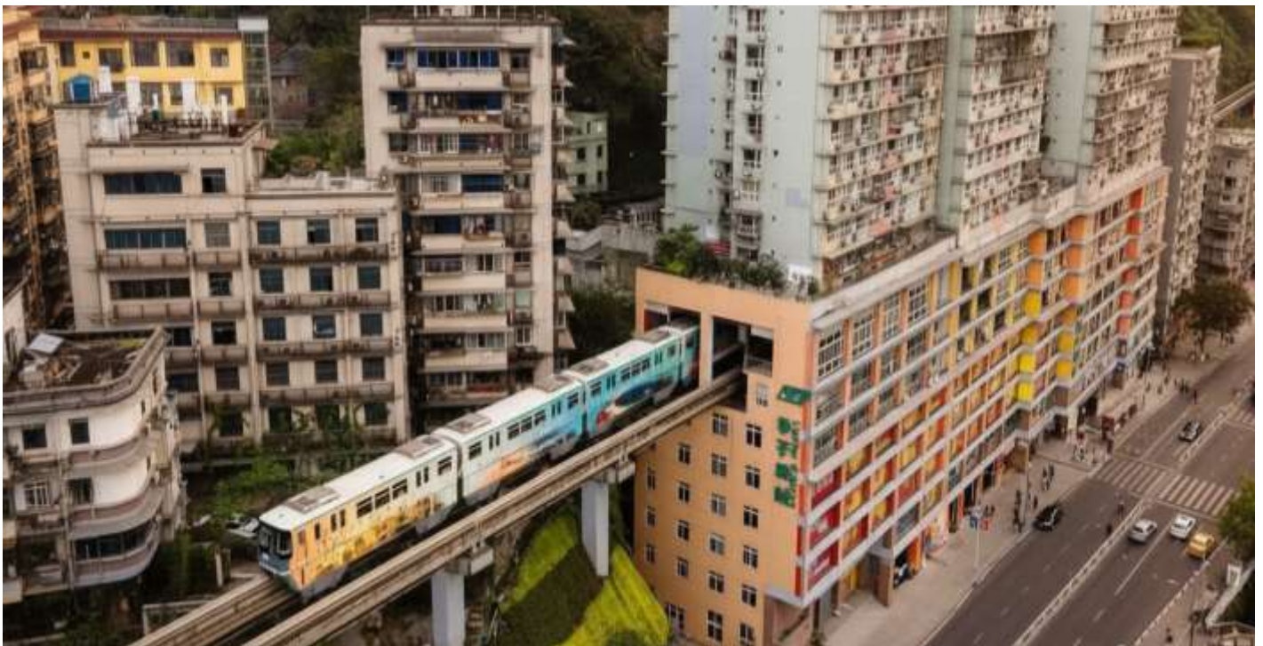
บ่าย นำท่านแวะเช็คอิน สถานีรถไฟฟ้าทะเลตุ๊ก (Liziba Station) ชมภาพรถไฟฟ้าวิ่งทะลุกลางอาคารพักอาศัยอย่างกลมกลืน ขบวนแล้วขบวนเล่าที่แล่นผ่านไปอย่างแม่นยำไร้เสียงรบกวน กลายเป็นสัญลักษณ์ระดับโลกของความอัจฉริยะทางวิศวกรรมและการออกแบบเมือง ที่สะท้อนแนวคิด “เมืองซ้อนเมือง” ของ